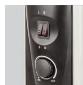
Vermogensselectie en instelbare thermostaat. Indicatielampjes.