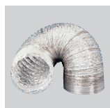
GSA-125 M0 GSA-150 M0 Conducto flexible de aluminio.