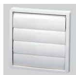
PER-100 W PER-125 W Persiana de sobrepresión.