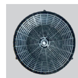
FILTRO CARBON VA E / HA E PLUS (2 uds. por campana)