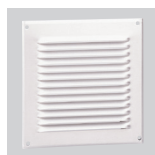
GRA-100 GRA-150 Reja de extracción de aluminio.