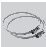
CX-125/215 Brida de sujeción.