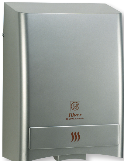
SL-2002 AUTOMATIC SILVER

Secamanos por aire caliente, con sistema de seguridad que evita el funcionamiento continuo en caso de que se coloque algún objeto debajo.