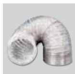
GSA-125 M0 Conducto flexible de aluminio.