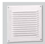
GRA-100 Reja de extracción de aluminio.