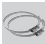
CX-125/215 Brida de sujeción.