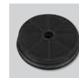
FILTRO CARBÓN CIRCULAR 190