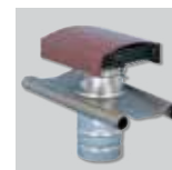
CT-125 Sombrero de tejado.