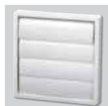
PER-125 W Persiana de sobrepresión.