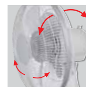
Cabezal inclinable y oscilante.